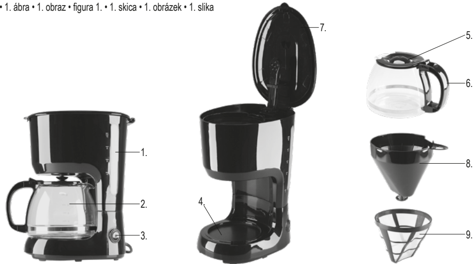
figure 1. • 1. ábra • 1. obraz • figura 1. • 1. skica • 1. obrázek • 1. slika