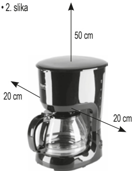
figure 2. • 2. ábra • 2. obraz • figura 2. • 2. skica • 2. obrázek • 2. slika